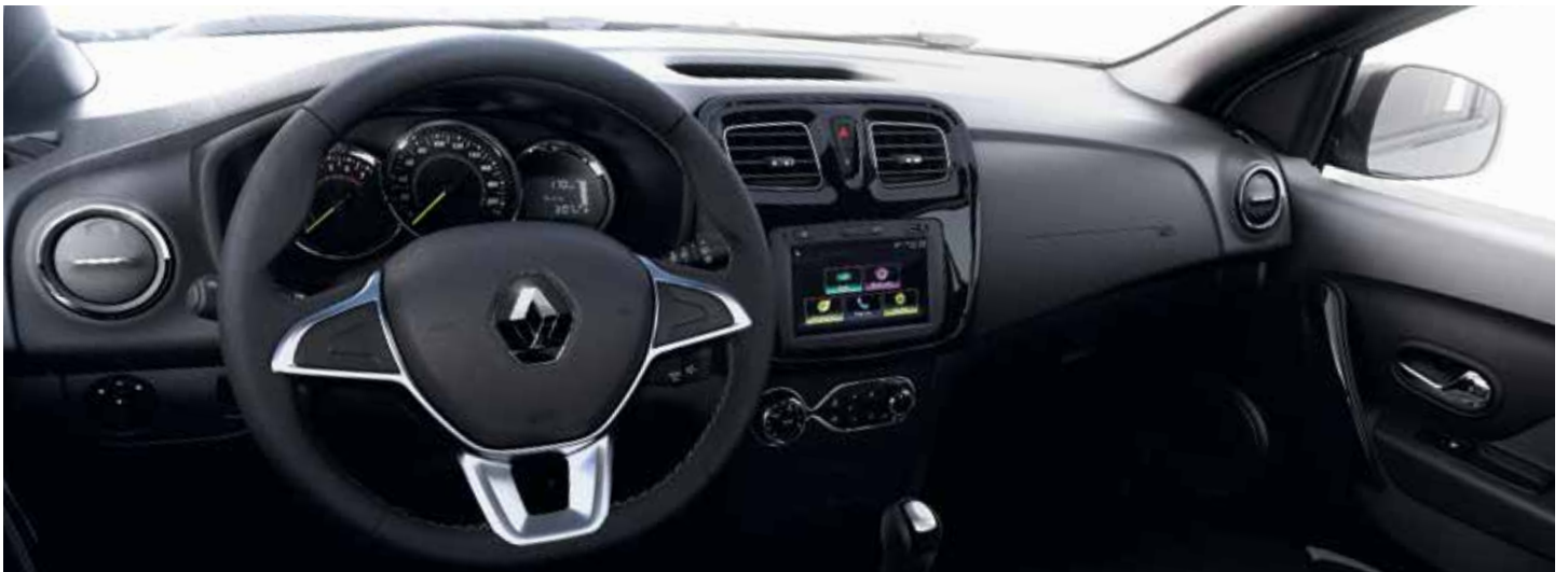
intens MT y CVT